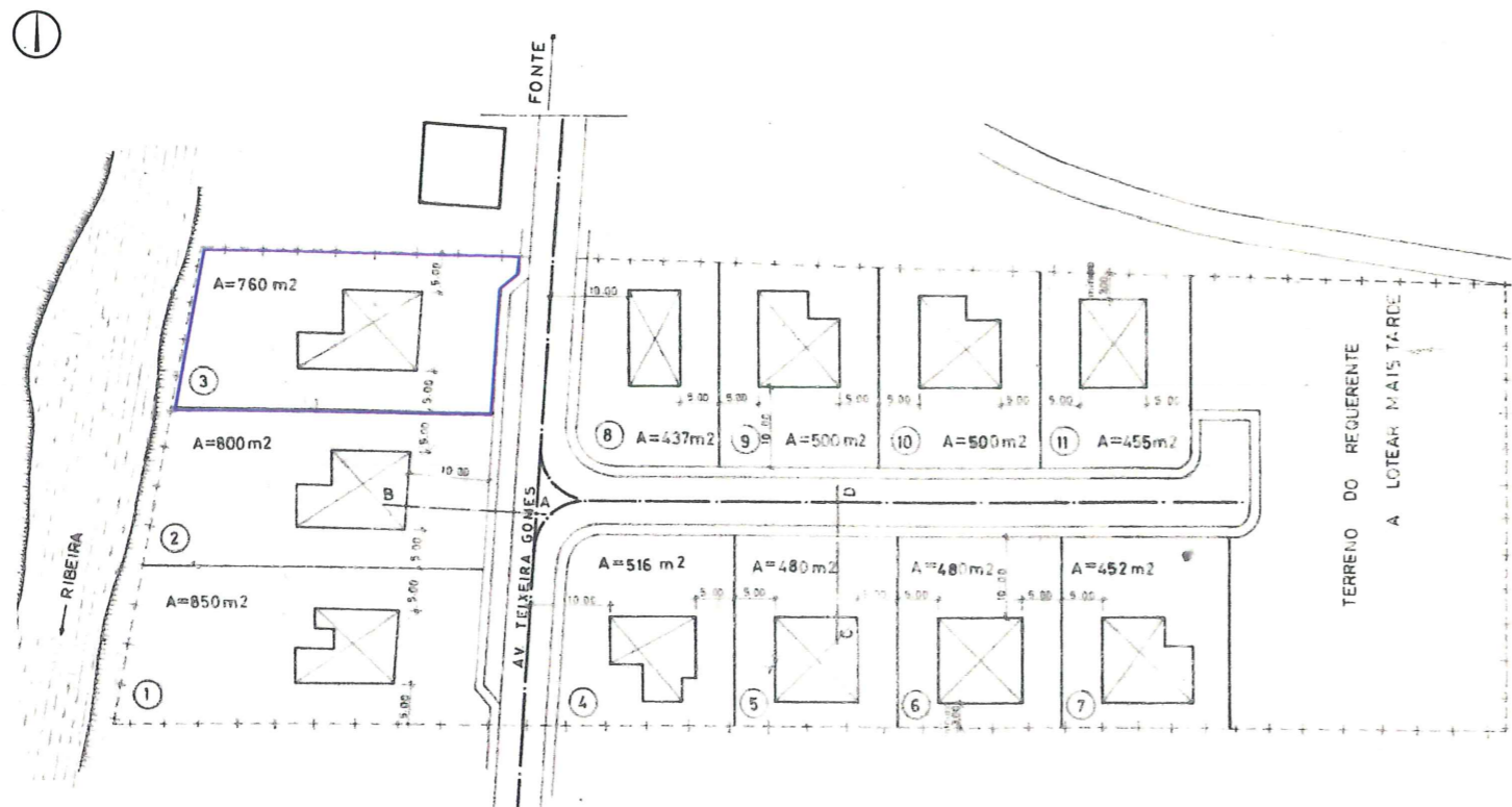
EXTRATO DA PLANTA DE SÍNTESE DO ALVARÁ DE LOTEAMENTO N.º 4/75